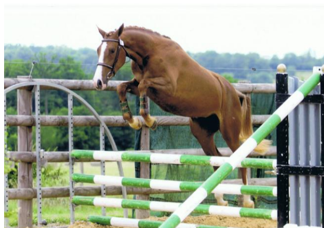
SF REGIONAL POULICHES DE 2 ANS JUILLET HARAS DU PIN 2010

SF – Femelle – ALEZAN - 1,64 m – née en 2008